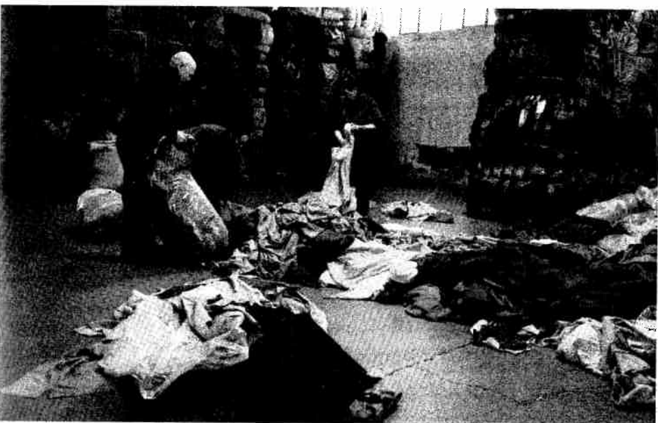
La cernita, una fase della rigenerazione