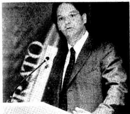
Il Presidente della Camera di Commercio Carlo Longo

Intervista a Carlo Longo , Presidente della Camera di Commercio di Prato Presidente, dato che già la stampa italiana ed estera conosce le caratteristiche del Cardato Co2 neutral, ci parli delle novità e degli sviluppi del marchio.