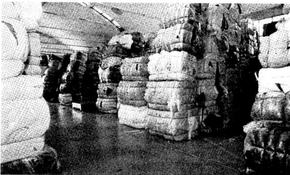
La meccanica, in tanti colori, riunita in balle impilate fino al soffitto