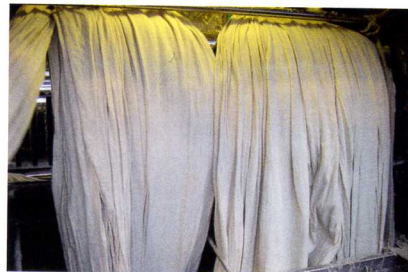
Le tissu est foulé the fabric is fulled

Prato, situated in the vicinity of Florence, is a textile region where the tradition of recycling wool goes back to the 19th century. Today, there are about forty companies federated beneath a new label "Cardato Regenerated CO 2 neutral" that are devoted to this industry and hope to make Prato the world centre for recycling fibres. The city today recycles 22000 tons of textile per year and since the 80's has been equipped with a purification station. It is the only city in Europe that possesses this kind of system that is appropriate in size for a city. It recycles 5 millions of litres per year which returns to the industrial circuit.