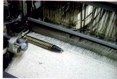
Le fil est tissé The yarn is woven