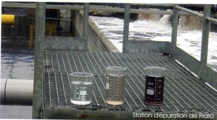
Station d'épuration de Prato

An industry emerges: recycling. As soon as man started manufacturing objects, he has recycled them. So much so that one can even say that this activity is as old as man. However, it was only in the 80's with the increase in ecological preoccupations that recycling started to develop. Anyone concealing the fact of treating recycled materials can now be proud: recuperation has become an added value.